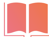
パッケージデザイン