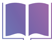
ユーザーインターフェイスデザイン