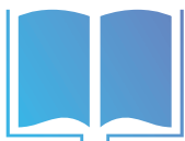
エディトリアルデザイン