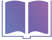
コンピュータグラフィックス