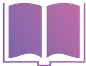
グラフィックデザイン