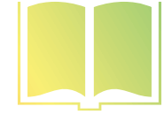
セールスプロモーション