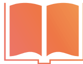
コピーライティング