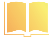
イラストレーション