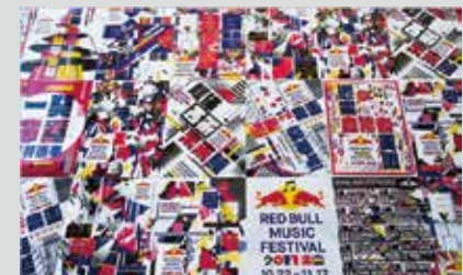
Red Bull Music Festival Tokyo 2017