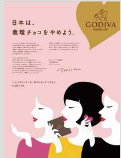
Godiva: 2018 Valentine's Day Campaign