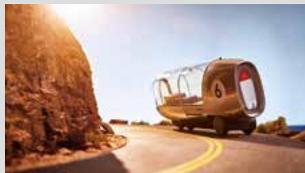
Honda. Great Journey.