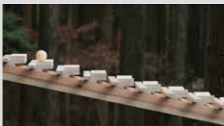
NTT Docomo: Xylophone 森の木琴