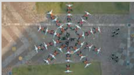
OK Go: "I Won't Let You Down"

TED: Ads Worth Spreading、MTV Video Music Awards、D&AD Yellow Pencil、カンヌ国際広告祭 金賞、One Show 金賞、Spikes Asia グランプリ、AdFest グランプリ、ACC グランプリ、TCC 金賞、ADC 金賞、広告電通賞 最優秀賞、グッドデザイン賞 金賞、Penクリエイターアワード2017など、内外で受賞多数。